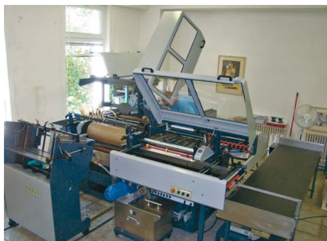
Zariadenie na výrobu knižných dosiek (väzba v8)

Ktorý z titulov vydavateľstva VEDA vydavateľstva SAV pokladáte za zaujímavý?