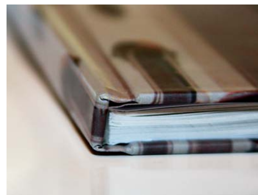
Laminovanie elektrografických digitálnych výtlačkov dovoľuje napríklad náročné knižárske spracovanie aj pri malých nákladoch.

Súčasná podmienky na trhu ešte viac zvýraznili tlak na cenu, kvalitu a rozmanitosť. Spôsob boja o klienta výhradne cez ceny považujem za nezdravý pre celú polygrafiu. My sme sa rozhodli ponúknuť klientom predovšetkým nadštandardnú kvalitu tlače i slu-