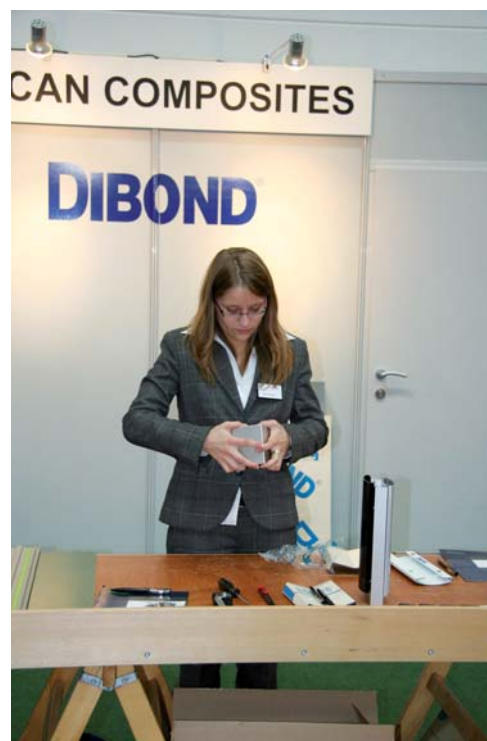
Takto vyzerali ukážky v „uličke remesiel“.

Zloženie návštevníkov veľtrhov vizuálnej komunikácie je iné ako pri tradičných polygrafických veľtrhoch. Aj tu však podstatnú časť odbornej verejnosti tvoria výrobcovia reklamy a pracovníci reklamných agentúr. Organizátorom sa podarilo naplniť sprievodný program zaujímavými témami na všetky tri dni konania veľtrhu. Navyše súčasne sa uskutočňovali až tri okruhy prednášok na rôznych miestach. Skutočne bol problém vybrať si, ktorá téma je zaujímavejšia. Horúcou novinkou bola tlačiareň HP Designjet L25500. Spoločnosti