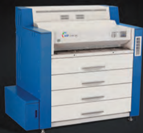
KIP Color 80

ZVÝŠTE RÝCHLOSŤ VAŠEJ VEĽKOFORMÁTOVEJ TLAČE